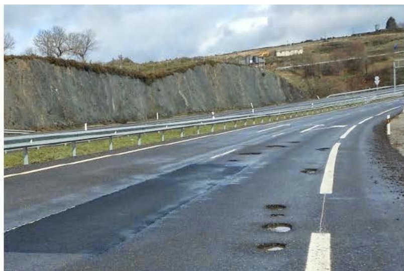
Deterioro a los 18 meses